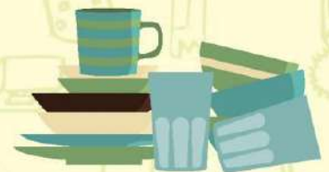
ใช้ภาชนะที่ใช้ซ้ำได้