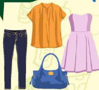
นำเสื้อผ้าไม่ใช้ ไปบริจาค