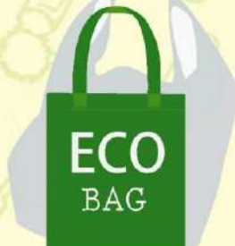
ใช้ถุงผ้า แทนถุงพลาสติก