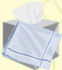
ใช้ผ้าเช็ดหน้า แทนกระดาษทิชชู