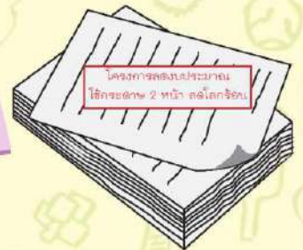
ใช้กระดาษ ให้ครบ 2 หน้า