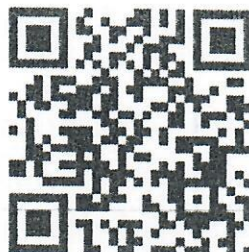
ข่าวประชาสัมพันธ์